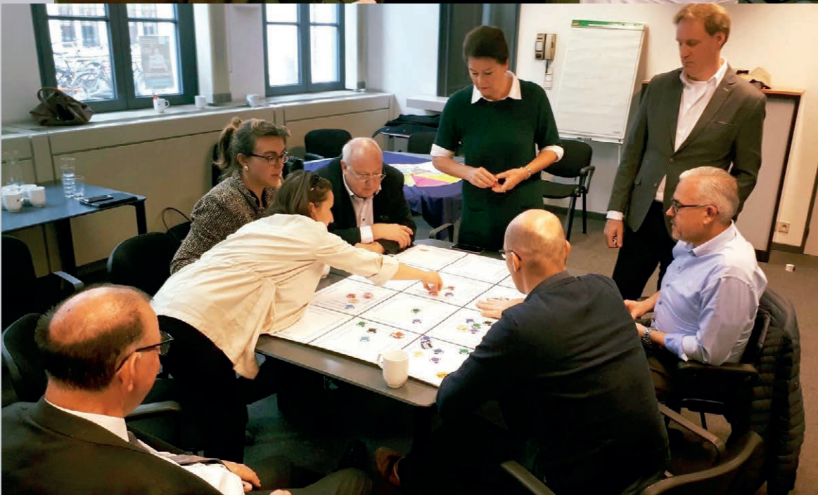
Werkbezoek college aan Antwerpen - 23 oktober 2019