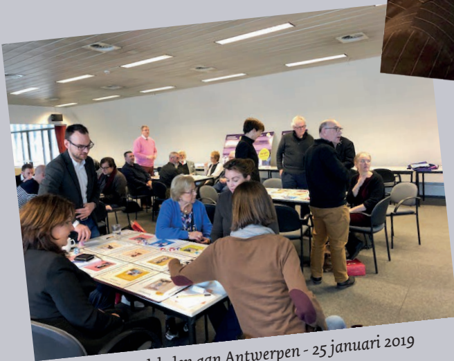
Werkbezoek raadsleden aan Antwerpen - 25 januari 2019