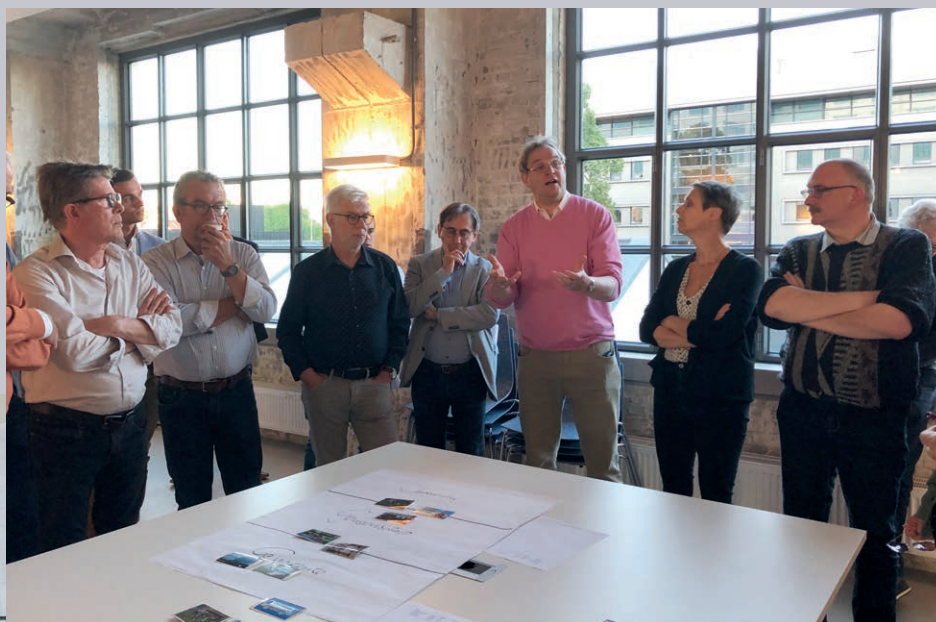
Themabijeenkomst burgerparticipatie gemeenteraad - 15 mei 2019